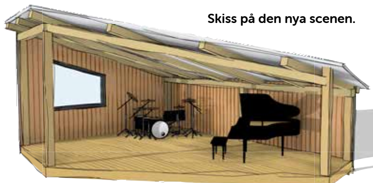
Skiss på den nya scenen.